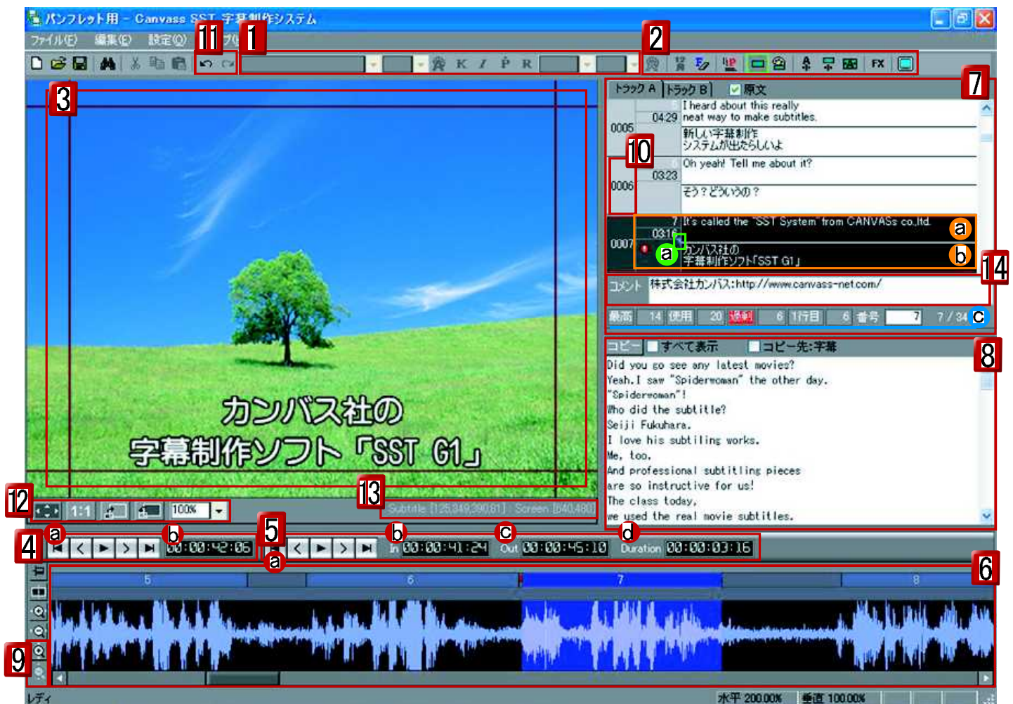
この画面は、字幕番号7番が選択、表示されている状態